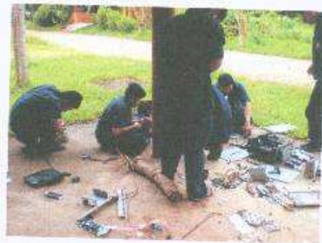
นักเรียนนำเศษวัสดุเล็กประกอบเป็นหุ่นยนต์จิ๋ว