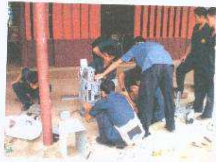
นักเรียนแต่ละกลุ่มนำเศษวัสดุประกอบเป็นหุ่นยนต์