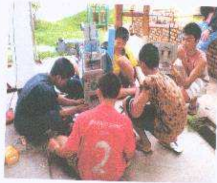
ผลงานปวช.1 ทุกแผนกครับ