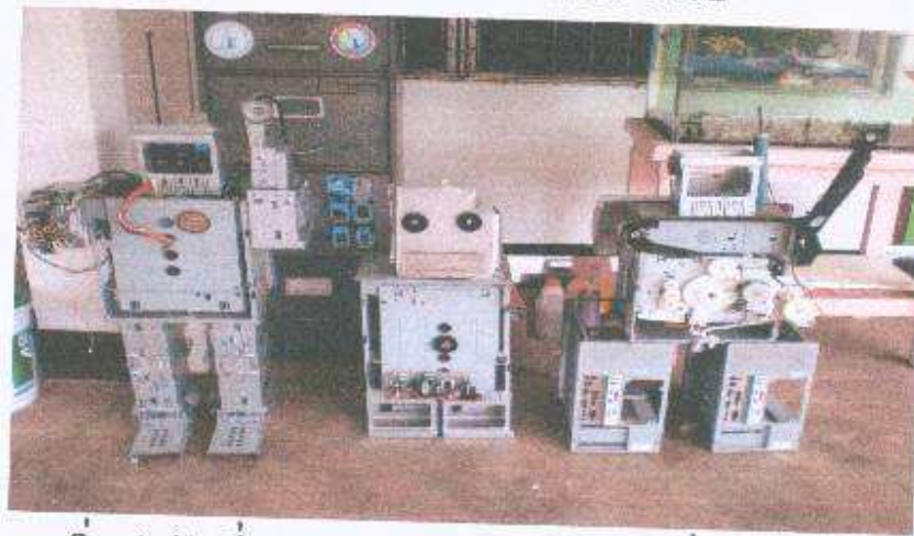
เริ่มทำวันที่ 27 ส.ค. 52 เสร็จวันที่ 3 ก.ย. 52